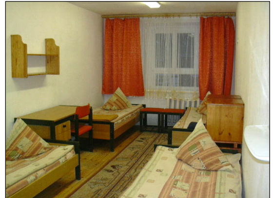
Dringend benötigte Einzel- Kindervollholzbetten

Da das Kinderzentrum inzwischen vermehrt Kinder im Vor- und Grundschulalter aufnimmt, die auf den Etagenbetten ihr Bett nicht herrichten können, sollen diese durch Einzelbetten ersetzt werden. Pro Kinderzimmer werden daher zukünftig vier Einzelbetten stehen.