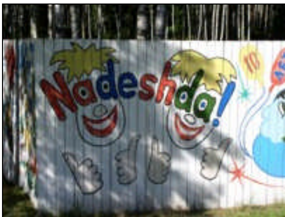
Zentrum Nadeshda – Leben nach Tschernobyl e.V.

Verschenken Sie zwei Kinder-Holzbetten im Wert von insgesamt 110 Euro